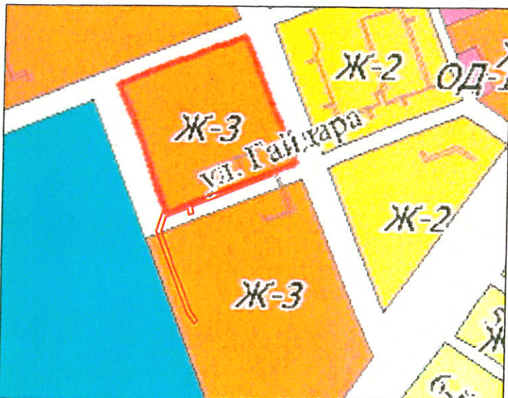
Фрагмент карты градостроительного зонирования г. Северодвинска. Масштаб 1:3000